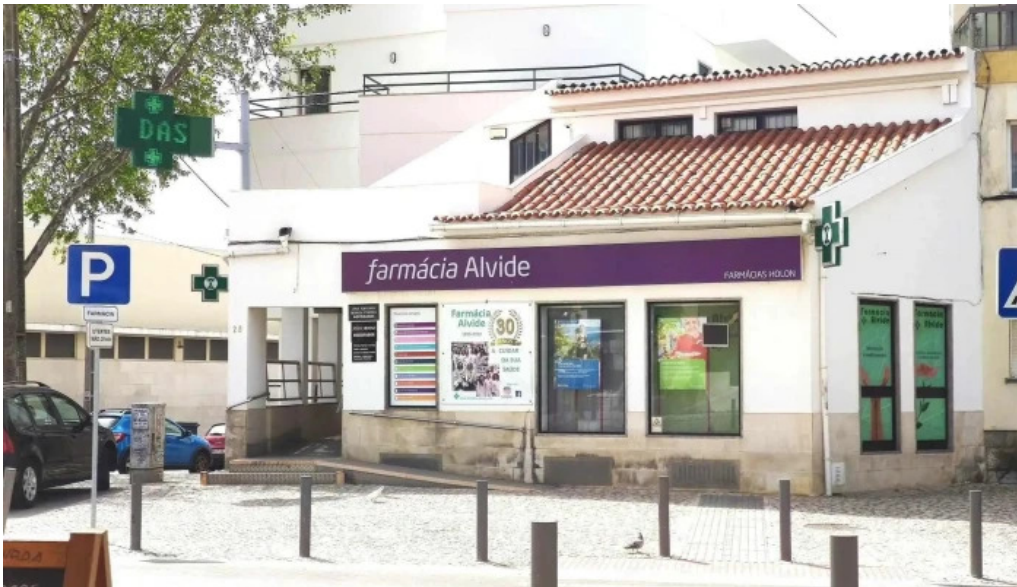
Farmacia alvide tudo