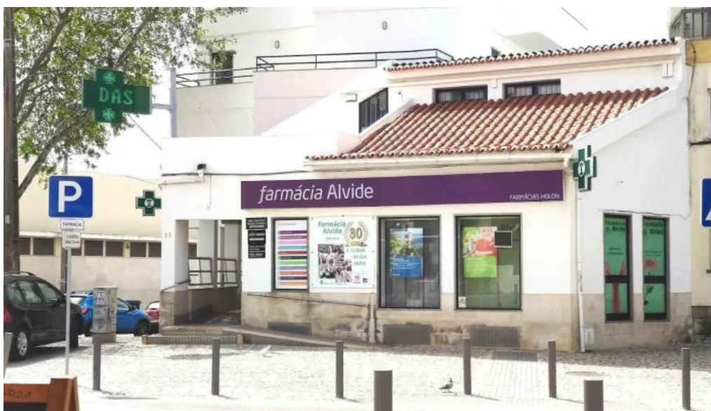
Farmacia alvide alcabideche