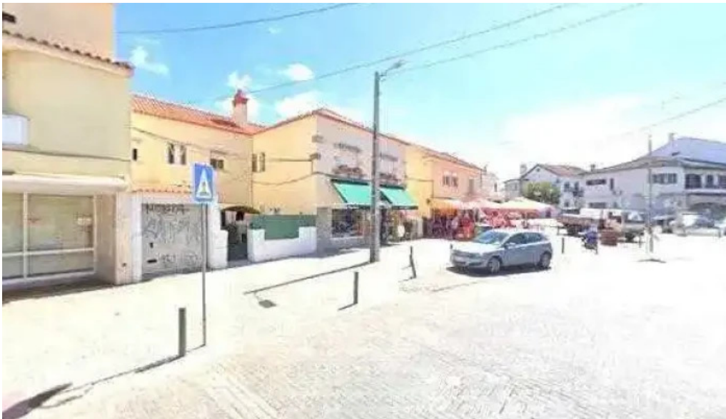
Farmacia alvide street view e 360deg