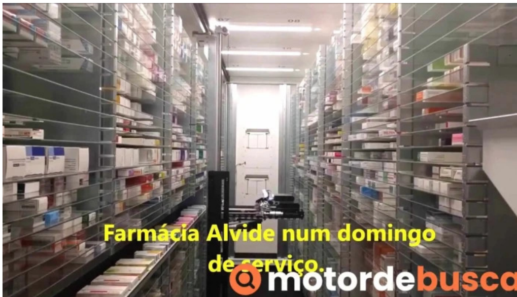
Farmacia alvide do proprietario