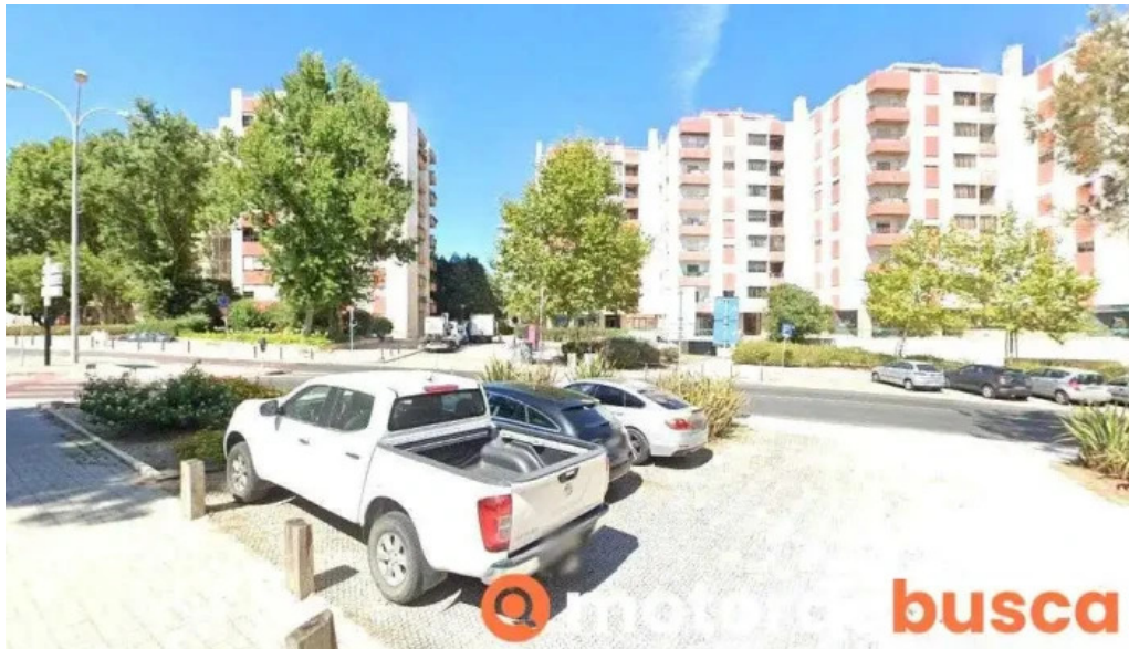
Pires robalo prestacao de servicos medicos Ida alges