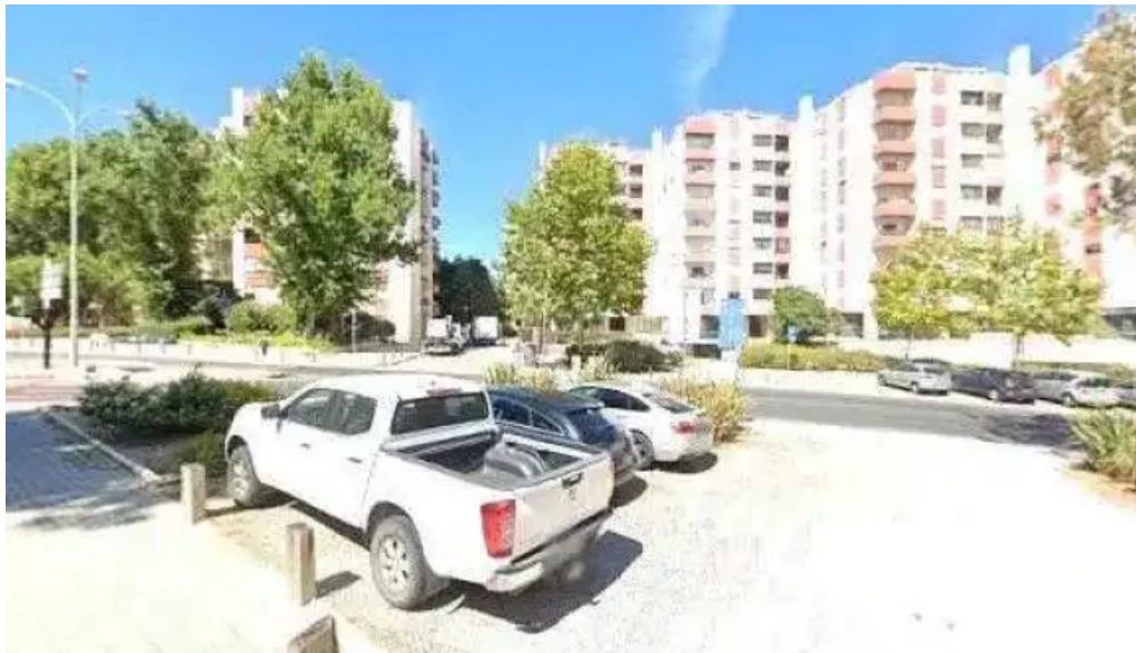
Pires robalo prestacao de servicos medicos Ida tudo