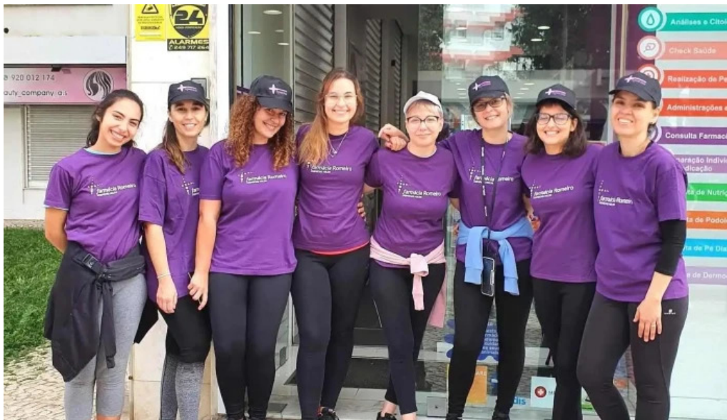
Farmacia romeiro do proprietario