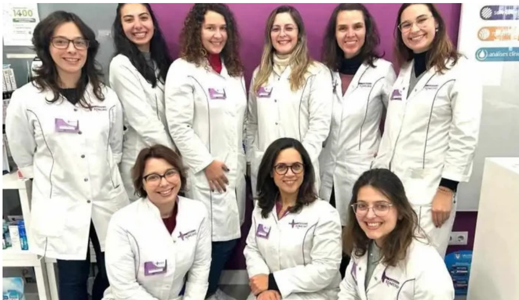
Farmacia romeiro mais recentes