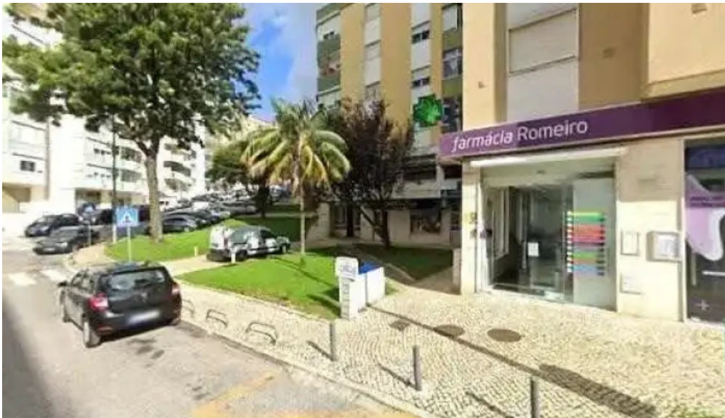
Farmacia romeiro street view e 360deg