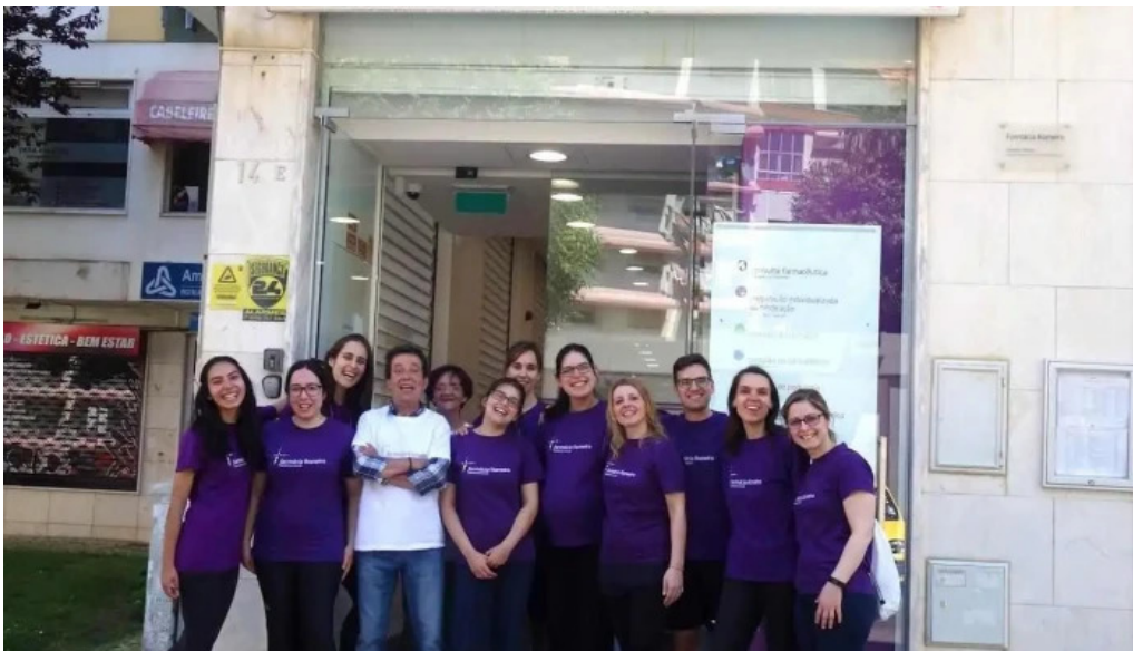
Farmácia romeiro tudo