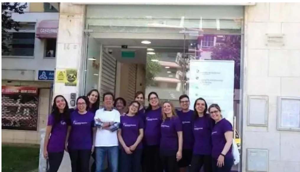
Farmacia romeiro amadora