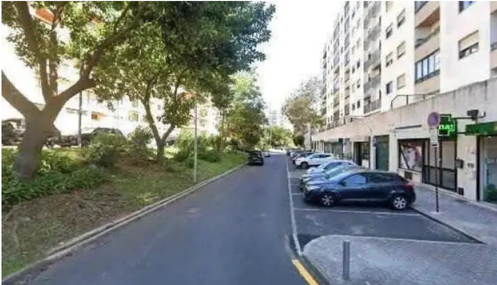
Farmacia nova de carnaxide street view e 360deg