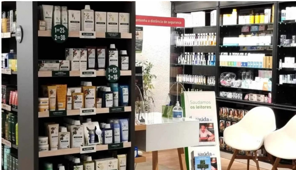
Farmacia nova de carnaxide do proprietario