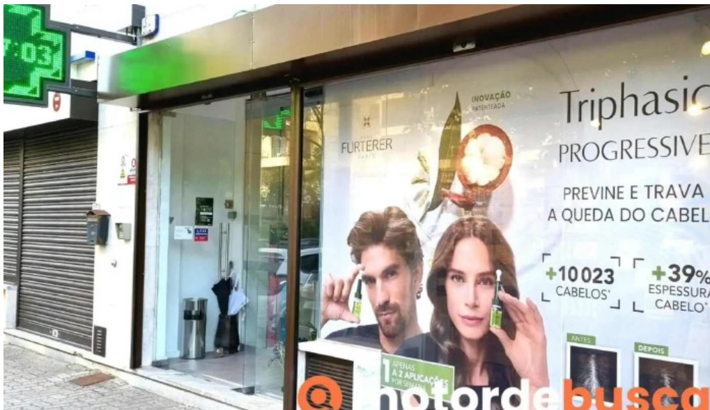
Farmacia nova de carnaxide carnaxide