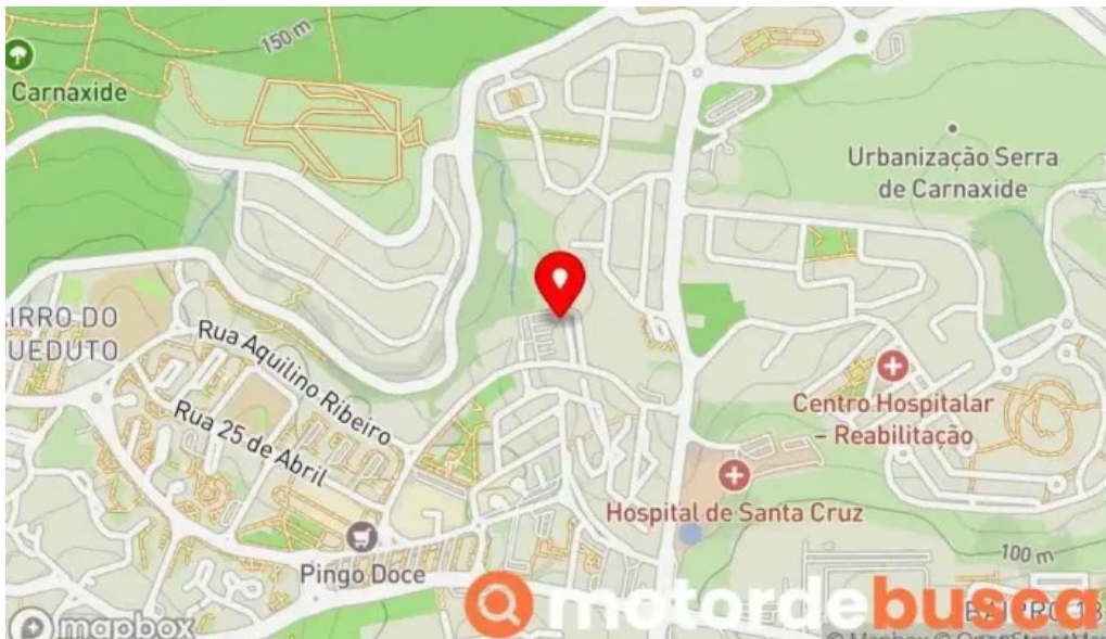
Farmacia nova de carnaxide mapa