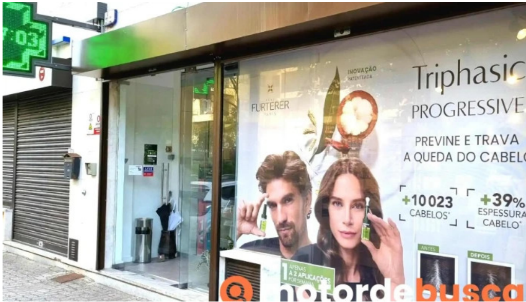
Farmacia nova de carnaxide tudo