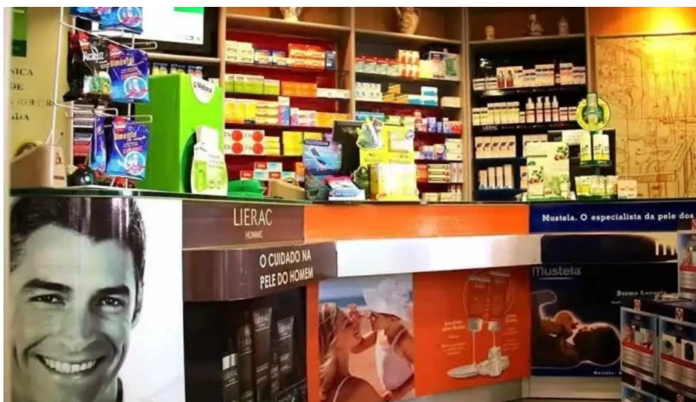
Farmacia melo almeida do proprietario