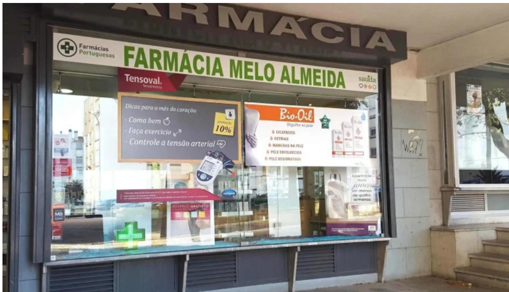
Farmacia melo almeida tudo