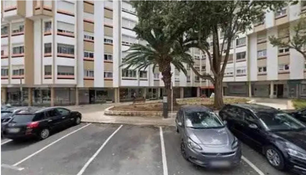
Farmacia melo almeida street view e 360deg