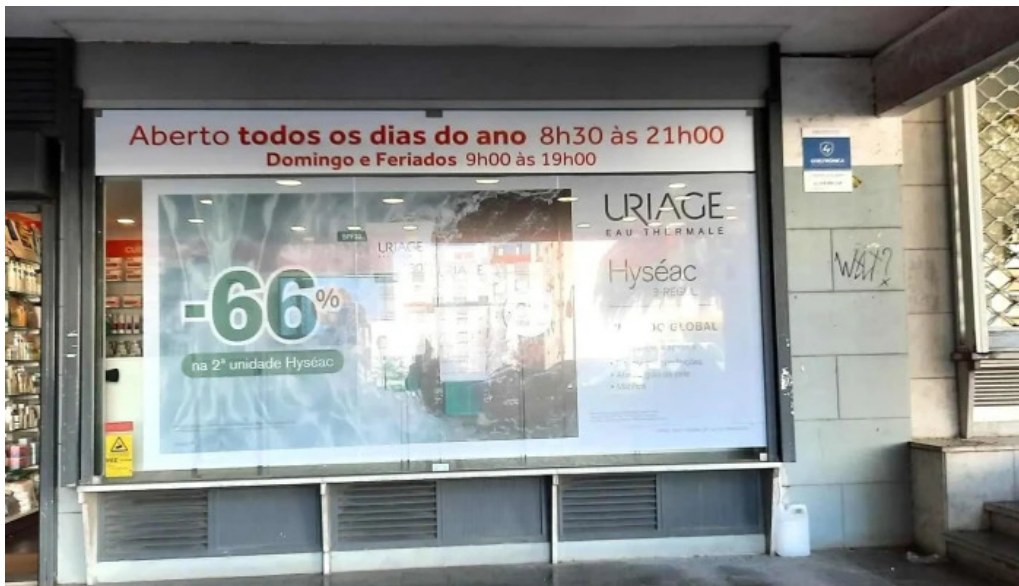
Farmacia melo almeida farmacia