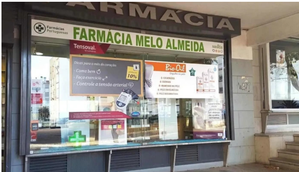
Farmacia melo almeida linda a velha