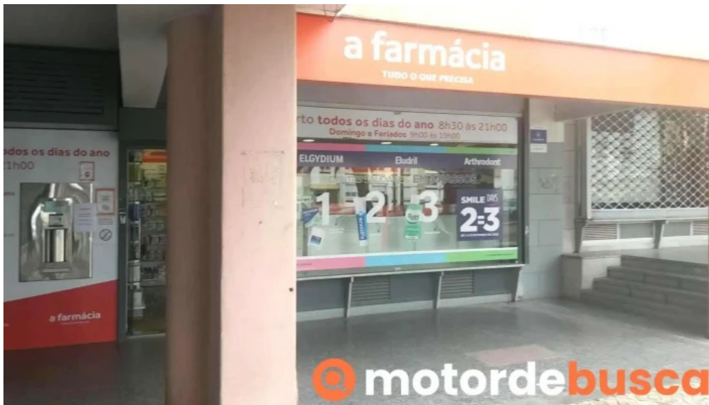
Farmacia melo almeida videos