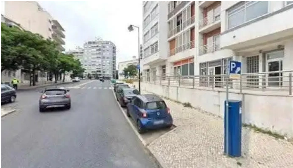
Farmacia iberia street view e 360deg