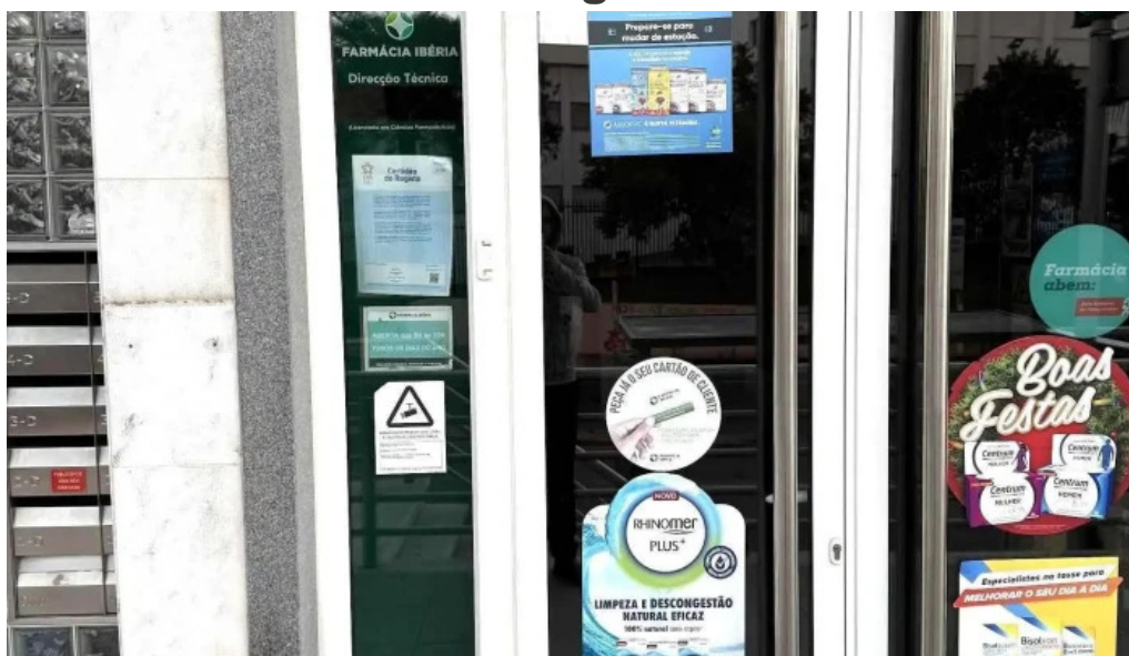
Farmacia iberia tudo