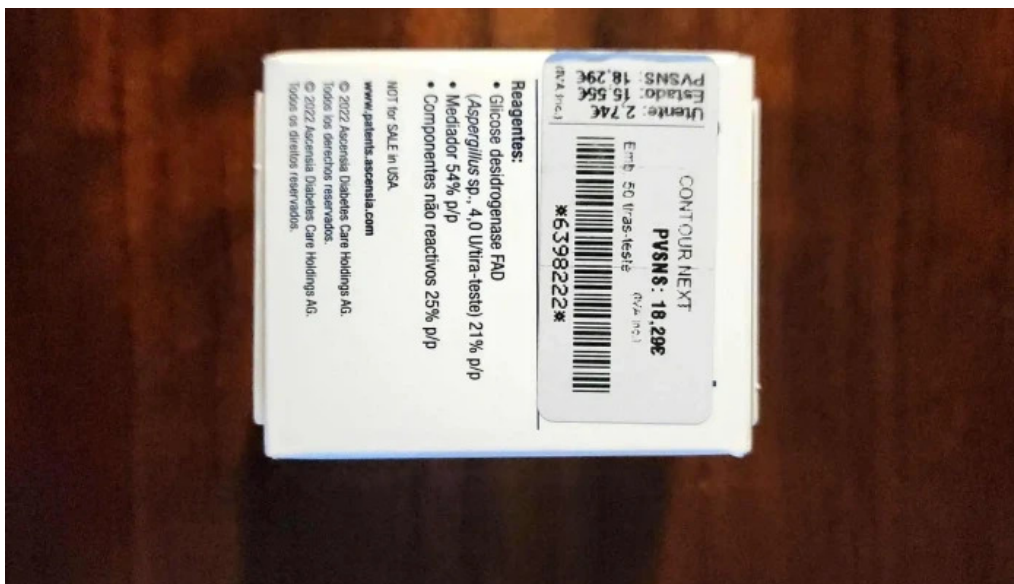
Farmacia iberia lisboa