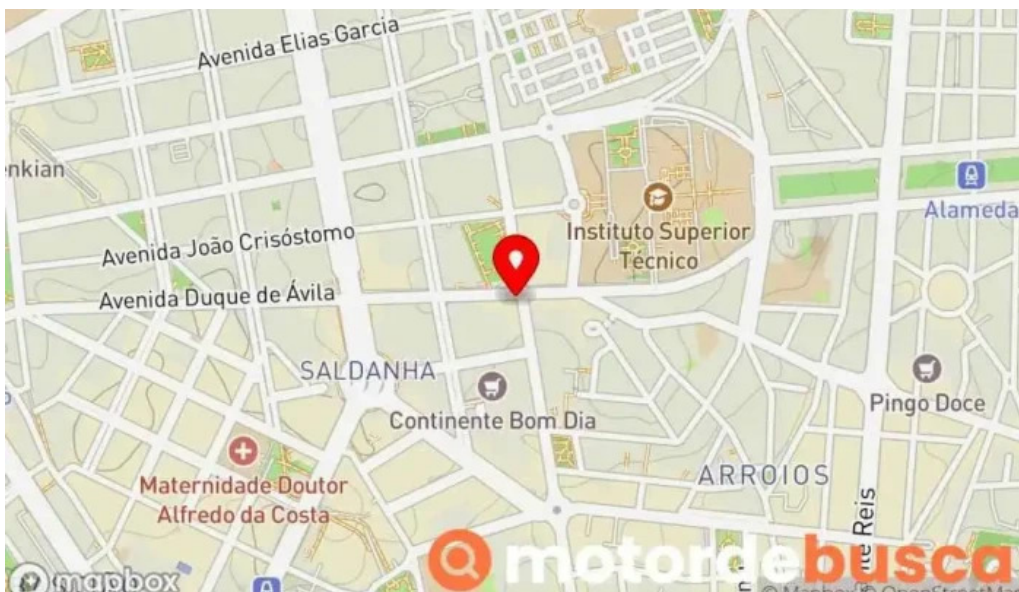
Farmacia palma mapa