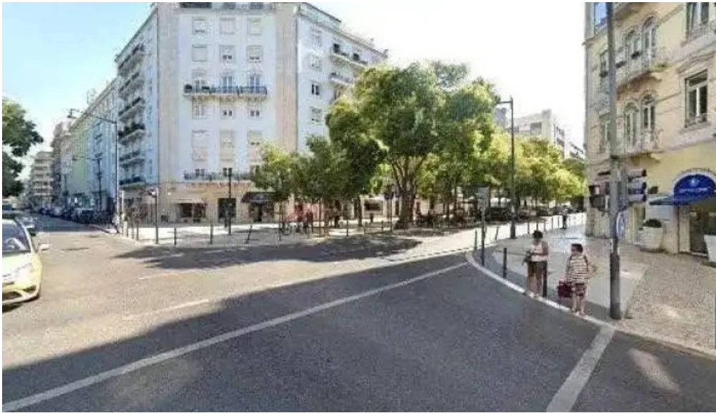
Farmacia palma street view e 360deg