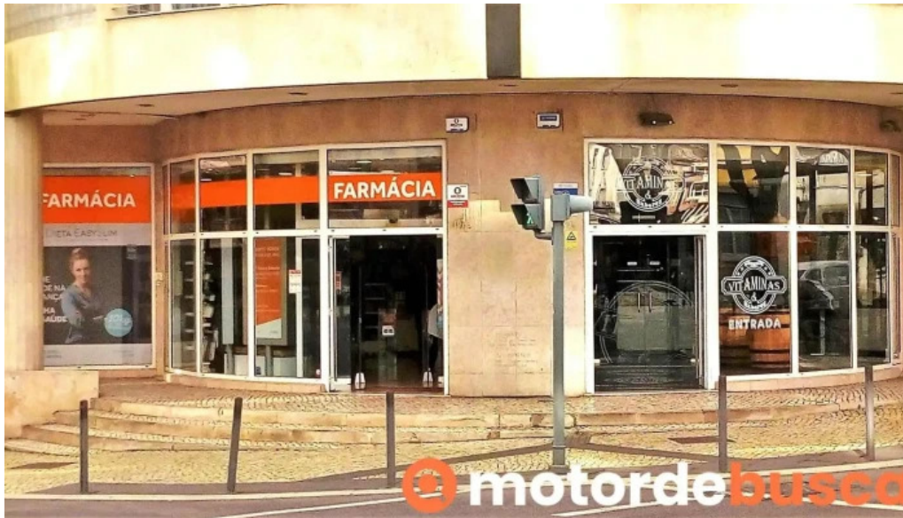
Farmacia palma lisboa