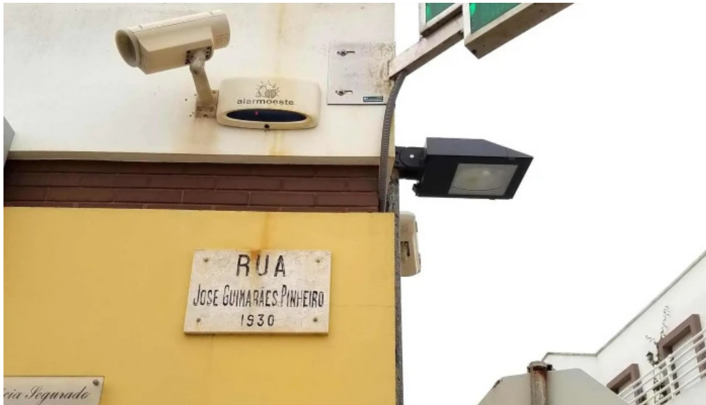
Farmacia seguro santa cruz farmacia