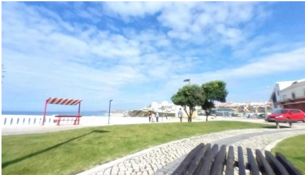
Farmacia segurado santa cruz street view e 360deg