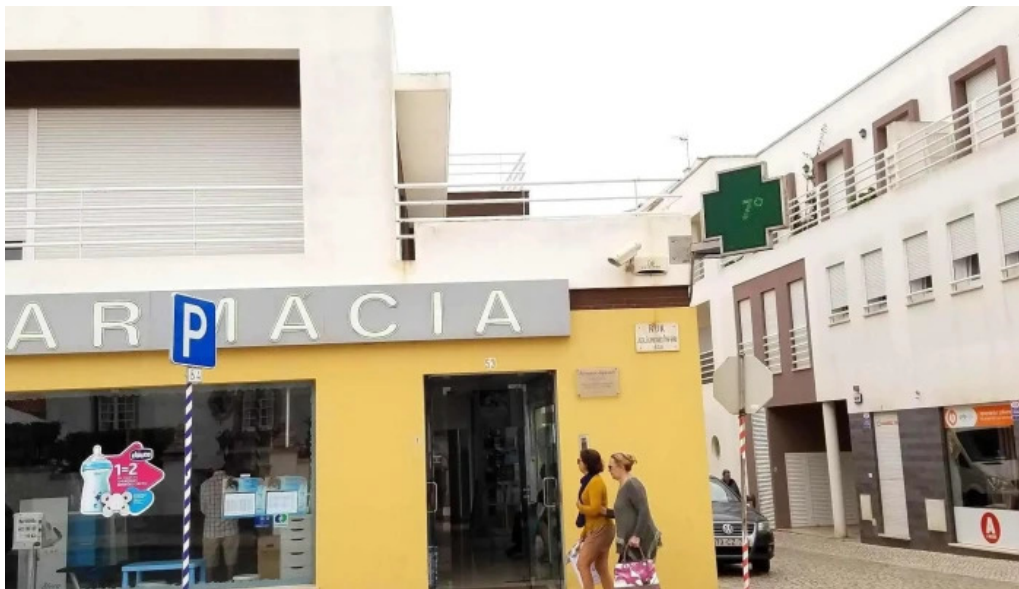
Farmacia segurado santa cruz silveira