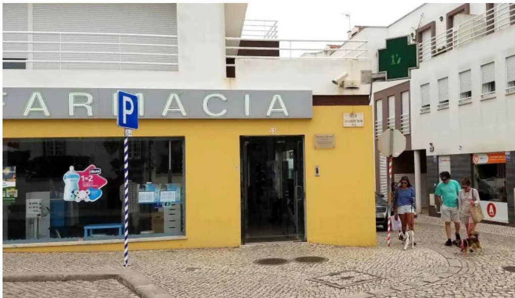
Farmacia segurado santa cruz promocao