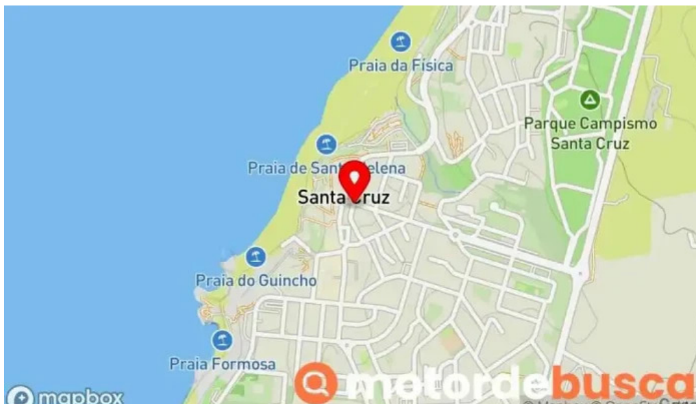
Farmacia asegurado santa cruz mapa