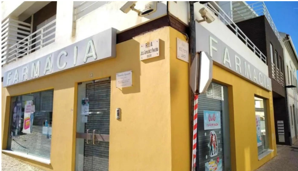
Farmacia segurado santa cruz tudo